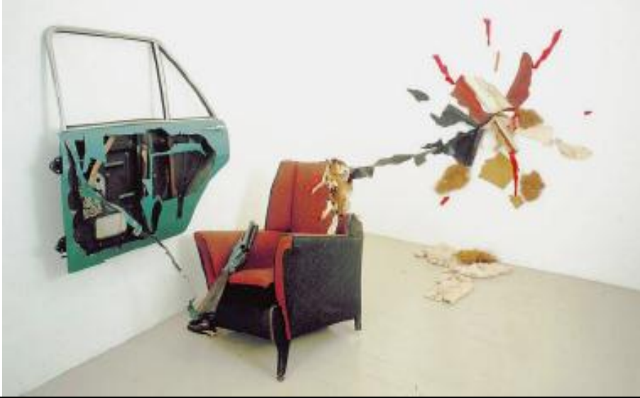
شكل (٢) الفنان الانجليزي بيل وودرو_ بعنوان " باب سيارة وكرسى وحادثه " اشياء مجمعة _ ٢٥٠×٢٥٠ سم ١٩٨١ _ ودينجتون جاليري _ لندن