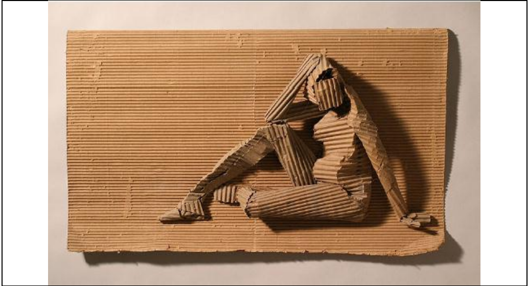
شكل (٤) الفنان " الكس أوريبى Alex Uribe " جودى - ورق كرتون - ٧،٤٥،٢x٧٦سم - ٢٠٠٦

ومن الخامات التي استخدمت حديثا في النحت البارز الورق اما عن طريق استخدامه كعجائن ورقية واما باستخدامه عن طريق الضغط في قوالب معدنية، وهي طريقه من طرق الحفر الغائر في فن الجرافيك Engraving، وهذا ما يؤكد مدى تأثير الفنون المعاصرة على اذابة الفوارق بين شتى انواع الفنون، ومن الفنانين اللذين استخدموا الورق في أعمال النحت البارز الفنان " الكس أوريبى Alex Uribe " (١٩٥٧) شكل (٤) وهي منحوتات بارزة شديدة البروز بعنوان " جودى " استخدم فيها الكس ورق الكرتون المتموج بلونه البنى الفاتح المعروف Cardboard وقد نتج عن تلك التموجات مجموعة من الخطوط المنتظمة، ولم تساعدة الخامة في اظهار تفاصيل الشكل بقدر ما منحته من معطيات تشكيلية وتعبيرية رائعة استطاع بها " الكس " تجسيد شخصية الفتاه الجالسة على الارض في لحظة راحة وتفكير واضعة يدها على رأسها ومستندة بالاخري على الارض، وقد القت كتلة الفتاة مجموعة من الظلال على الخلفية لتظهر بذلك شدة بروز الشكل الذى ظهر في اليدين اللتان تم تشكيلهما بصورة أقرب الى النحت الدائرى، وفي شكل (٥) بعنوان " ساشيكو Sashiko " وهو بورتريه استخدم فيه الكس نفس الخامة وان اختلف في اسلوب الصياغة حيث تم تطبيعه على مجسم لپورتريه من خامة أخرى صلبه حتى تم جفاف ورق الكرتون تماما وأخذ شكل المجسم، كما تظهر في الشكل الخطوط الطولية لخامة الكرتون، ولم يضيف الفنان أى الوان أو صبغات للشكل بل تركه بالوانه الطبيعية .