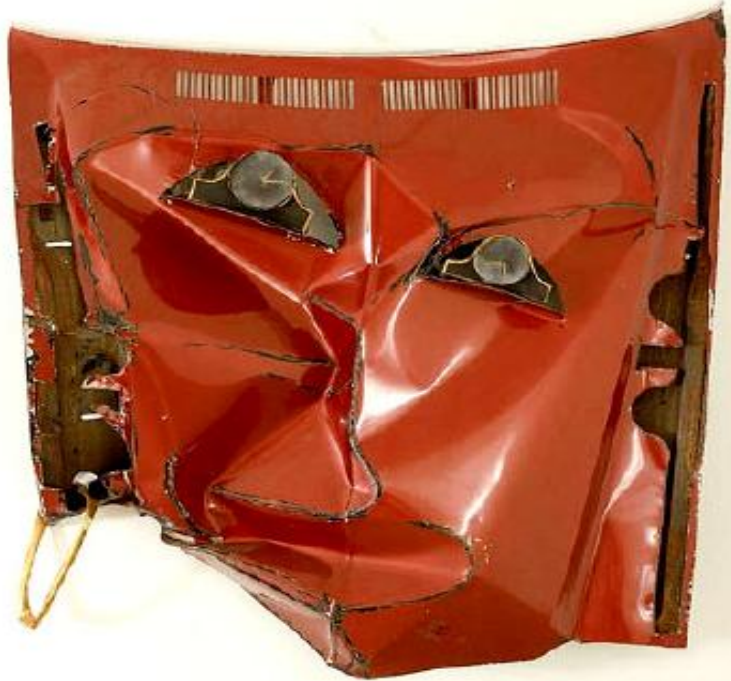
شكل (٣) الفنان الانجليزي بيل وودرو_ بعنوان " وجه صديقة " جزء من سيارة ( معدن + اكريليك ) ١٦٠×١٥٧,٥×٤٠ سم _ ١٩٨٤