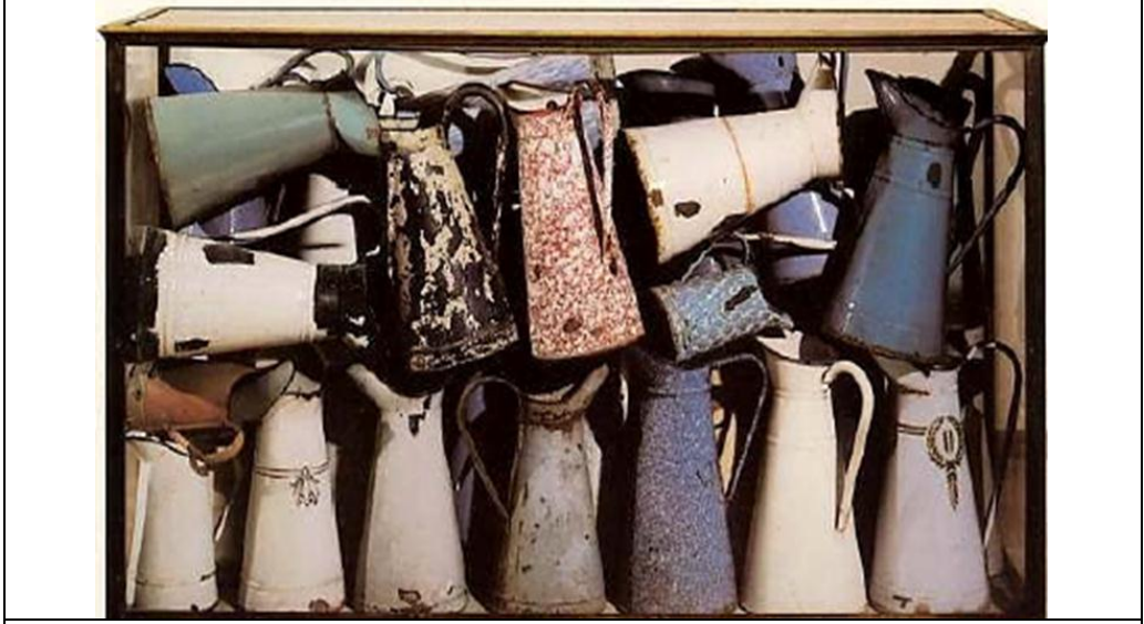
شكل (٦) من اعمال الفنان ارمان Arman_ عمله المسمى " أباريق مكدسة " _ ١٩٦١

تجربة الباحثة ونماذج لبعض اعمال الطلاب :