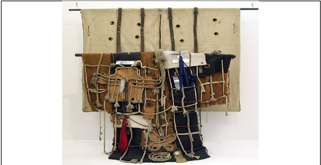
شكل (١) للفنان الفرنسي اتين مارتن Etinne Martin خامات متعددة ٢٥٠×٣٠سم المتحف

كما تناول الفنان الانجليزي بيل وودرو بقايا السيارات المتهالكة وحولها الى أعمال فنية شكل (٢) بعنوان " باب سيارة وكرسی وحادثة " وهي صياغة فنية بهدف فلسفي الى تنبيه الانسان بمعنى حوادث الطرق، والتي تؤكد طغيان الاله على الانسان الذي صنعها بيده حيث يتضح ذلك في اثار التدمير التي تظهر على الكرسي وقد تناثرت تلك الاجزاء على الجدار المقابل، وبذلك خرج " وودرو" من دائرة التمثال التقليدية ليندرج تحت مسمى العمل المركب المنتشر في معارض الفنون في أغلب المحافل الدولية حيث جاءت الاعمال المركبة من اتجاهات فن التصوير، وتطورت لتصبح محاولات لحل الفراغ، ولكن " وودرو " طوع النحت لان يكون عملا مركبا يقف بين الصورة المجسمة والتمثال، والتركيب الذي ادى الى خروج النحت من تقاليده المعروفة منذ القدم، وقد استخدم الفنان في هذا العمل مجموعة لونية مختلفة ساعدت بدورها في اثراء العمل الفني وهي الوان الاسود والاحمر والاصفر والبني، وفي شكل (٣) بعنوان " وجه صديقه " استخدم فيه الجزء الامامي للسيارة وطرقه في بعض المناطق بهدف محاكاة البنية التشريحية للوجه ،ومحاولة للوصول بتلك القطع الصماء الى اقرب شكل ممكن لوجه الانسان، حيث قام بعمل التجويفات لمنطقة العينين ووضع فيها دائرتين من الاكريليك الشفاف .