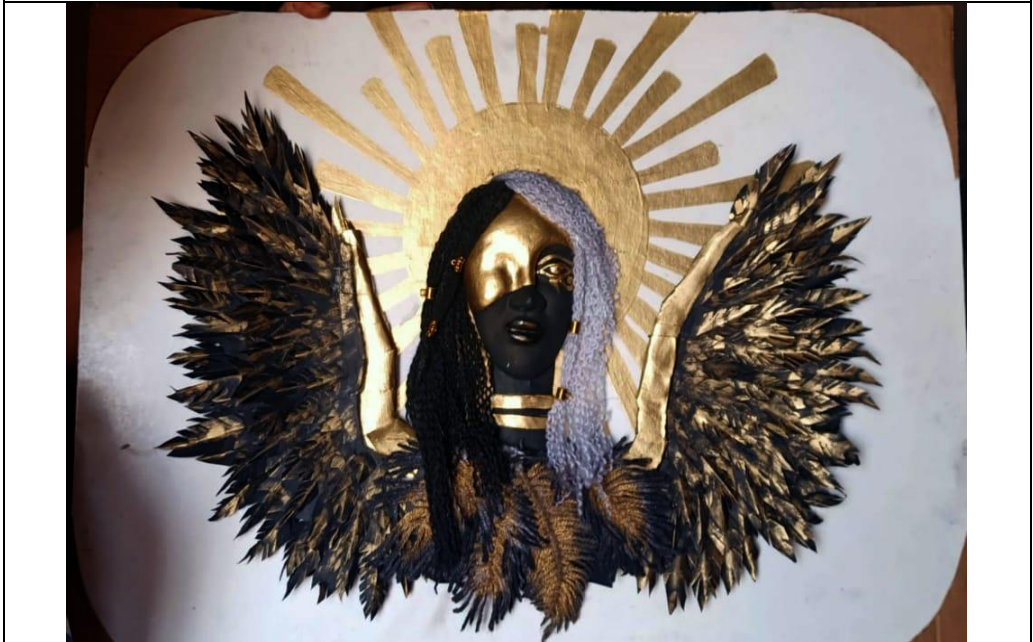
شكل (١٨) عمل الطالبة منار ياسر عرفة - ٧٠ × ٥٠ سم - عجينة ورق وورق كانسون ملون - ٢٠٢٢ - مصر - جامعة المنصورة.