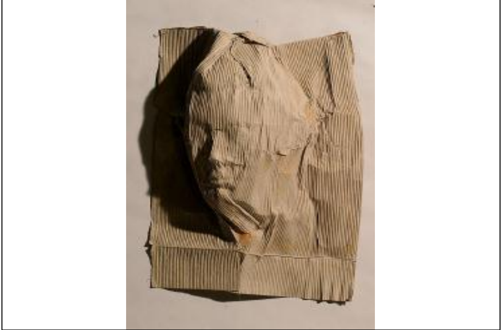
شكل (٥) الفنان " الكس أوريبى Alex Uribe " جودى -ورق كرتون- ٨٣,٨٧٠ سم -٢٠٠٧

الفنان ارمان Arman ( ١٩٢٨ ) والذى يعتبر واحدا من ابرز أنصار الواقعية الجديدة ويعتمد فى أعماله على تكرار عشوائى لأشياء جاهزة من نوع واحد، وقد ذكر بيير ديستانى Pierre Destany ايضا ( ان الواقعية الجديدة تسجل الحقيقة الاجتماعية دون اى هدف حقيقى ) ١ " وتشمل اعمال ارمان على تكديسات وتراكومات من بعض الصور والرسومات المطبوعة والأشياء الجاهزة التى تلتصق بالسلوب Rubber -Stamp الشبيهة بالاسلوب الاستيكريز " وكان أرمان صادقا مع نفسه وصريحا عند قوله بأنه لم ينجز شيئا جديدا .. بل كانت اعمال أرمان تحمل القليل من الواقع خلال رؤية المتسعة لجميع فنون العصور القديمة والحديثة ٢ " ومن اعمال ارمان شكل ( ٦ ) عمله المسمى أباريق مكدسة ١٩٦١ وفيه جمع الفنان اباريق الماء القديمة والصدئة ومنها الملون وما هو منقوش ووضعهم داخل فاترينة من البلاستيك الشفاف " وتتخلص فلسفة ارمان من تلك الأشياء بأنها بحث لوقف مفعول الحدث .. ووضع حد للسرعة والانفجار .. وذلك بتكديس أكوام من الأشياء الاوبجكت بداخل اطر مغطاة بالزجاج ... وكان يكس نفس الأشياء أثناء سخطه، وقد أطلق عليها أسم المنحوتات الانفعالية Action Sculpture ٣ .