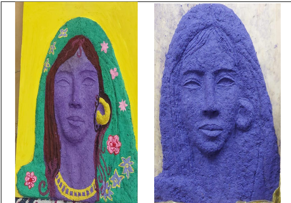
شكل (١١، ١٢)

جامعة المنصورة كلية الفنون الجميلة قسم النحت