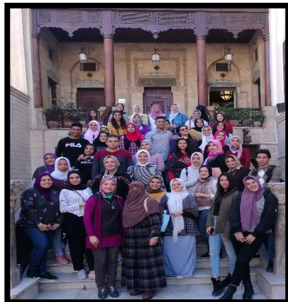
صور توضح ختام ورش العمل والزيارة الميدانية من اعمال الطلاب بمركز الخزف بالفسطاط