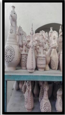
شكل ١: نماذج لصور فوتوغرافية لمركز الخزف والحرف التقليدية بمدينة الفسطاط بالقاهرة

وبالتالي فإن الحفاظ على الهوية لا يعنى الجمود في إطار من الموروث القديم، بل هو عملية تتيح للمجتمع ان يتغير ويتطور دون ان يفقد هويته الأصلية، وان يتقبل التغيير دون ان يتغرب فيه، إنه التفاعل بين الاصاله والمعاصرة، وإنه التفاعل بين الإيجابي البناء من الثقافات الأخرى وما يتفق مع مناخنا وأرضنا وتربيتنا. (٢) ومما هو جدير بالذكر أن " دراسة انماط الفنون الشعبية في مكان ما، ما هي إلا احدى محاولات الكشف عن ذات الانسان في هذا المكان من خلال صور واشكال