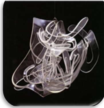
شكل (٢) (٢)