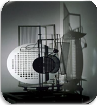
شكل (٣) (٣)

نتيجة للتقدم الصناعي في مجال إنتاج الخامات والأدوات توفر للفنان الحديث أدوات ووسائط مادية مثيرة للابداع الفني، فأصبح أمام الفنان كم هائل من الخامات المختلفة سواء من حيث ملمسها وألوانها وإمكاناتها لتشكيلية والخصائص المميزة لكل منها عن الأخرى. فالخامة يمكن أن تكون مصدراً هاماً من مصادر الإبداع الفني، لكنها تظل مختلفة عن الأعين طالما كان الإنسان غير مدرك لأهميتها فيمر عليها مروراً عابراً لا يمكن التوغل في قيمتها، فقد وفر التقدم التكنولوجي في العصر الحديث العديد من المواد الخام التي يساعد إستخدامها في تحقيق قيماً فنية جديدة .