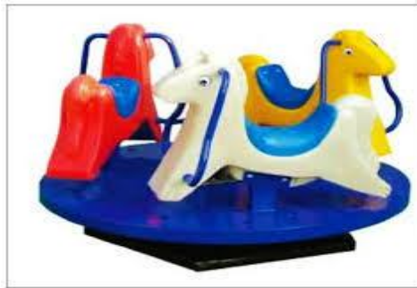
شكل (٣) نموذج للعبة طفل